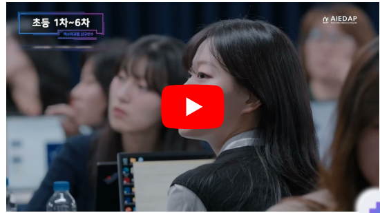
2025 마스터교원 신규연수(하반기) 스캐치